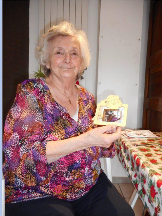
Un Ballotin de chocolat avec marrons glacés et un cadre photo personnalisé