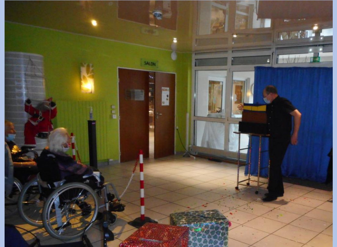
Spectacle de magie sous forme de « grande scène »