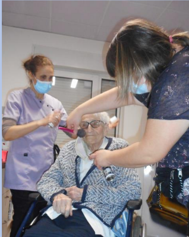
Mise en beauté des résidents par des professionnels venus bénévolement en dehors de leur temps de travail