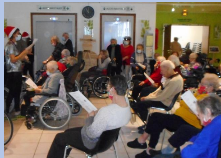
Repas au son de l'accordéon et après-midi musical