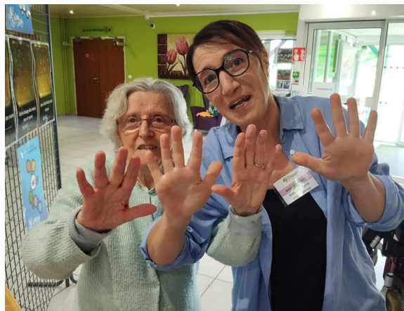
Participation à la journée mondiale de l'hygiène des mains