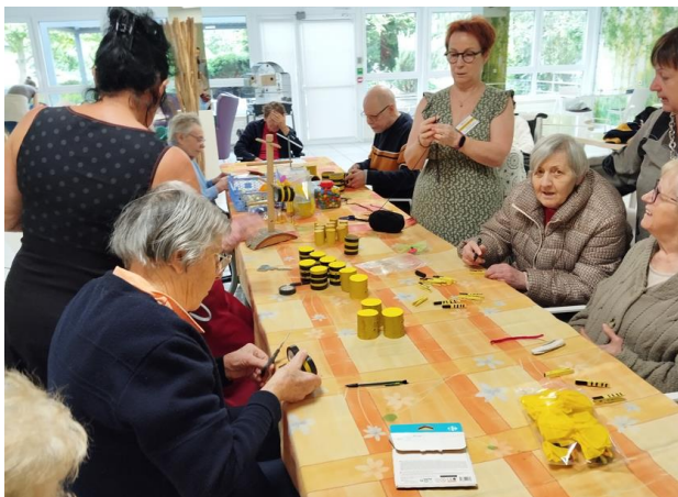
Mi- mai, atelier bricolage avec l'association « Hopla »