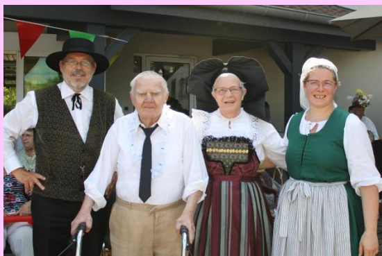
Fête d'été de l'EHPAD le 06 07 2023