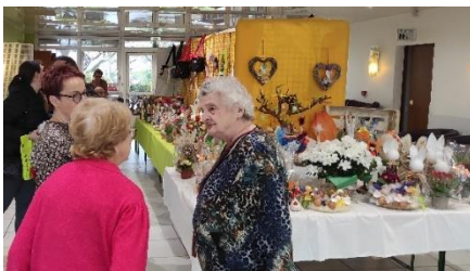
Marché de Pâques (25 03 2023)