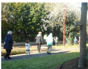
Chasse aux œufs avec les enfants des copains d'abords (05 04 2023)